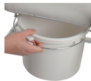
• Pict. 6

Use the toilet when the wheelchair is still. To use the toilet take out the removable part of the seat using the handle on the front part. Take out the toilet using the handle ( Picture 6 ).