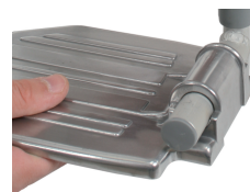
• Pict. 4

The footrest of shower chair can be adjusted according to various requirements. You have to push the locking clip on the footrest (Picture 4) not less than 6.5cm distant from the floor. Check that both footrest are adjusted at the same height.